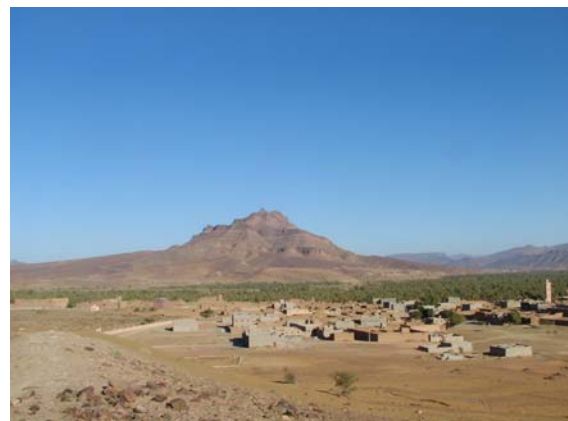
Lehmproben holen und Aussicht geniessen