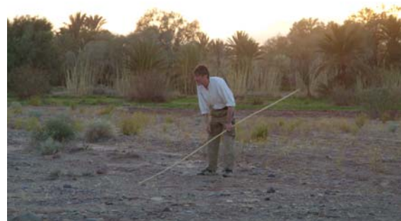
Ureinwohner bei der Jagd