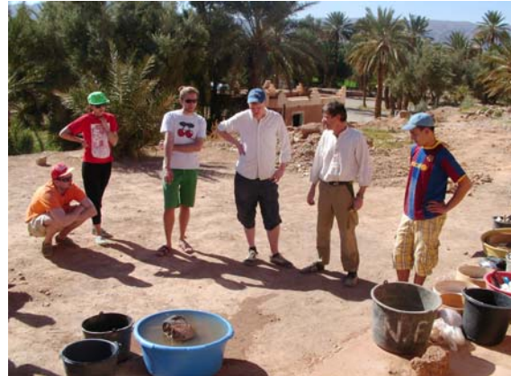
Bausitzung mit Wochenplan

Der Lehm wird angehäuft und ein Teil wird gewässert, je nach Konsistenz wird mehr Wasser oder weiterer Lehm vom Haufen hinzugeführt. Das trockene kurzstielige Stroh wird mit den Füßen eingestampft. Die Masse wird anschliessend in die Steinform geworfen, damit sich der Lehm in die Ecken drückt (die Masse muss dafür feucht genug sein). Die Holzform, vor dem Füllen gut wässern, damit der Lehm nicht daran kleben bleibt, wird gestrichen gefüllt, mit den Händen festgeklopft und eine kleine Häufung über die Form hinaus geformt. Die Form wird senkrecht nach oben abgezogen und mit Wasser wieder abgewaschen. An der Unterseite des frisch geformten Steins sollte sich kein Brei bilden – dann ist die Masse zu flüssig. So wird Stein für Stein geformt und an Luft und Sonne getrocknet. Sind die Steine noch feucht aber schon etwas fest, können sie zum schnelleren Trocknen gedreht und später aufgestapelt werden.