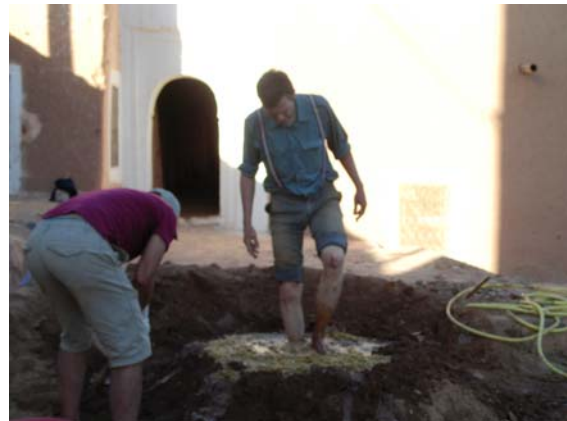
Und immer wieder Lehmtreten

Weiter Lehmsteinproduktion, Stampflehmwand und Reparatur einer Mauerkrone mit Lehmsteinen sowie Testfelder Lehmputz mit Kalkzuschlag anbringen.