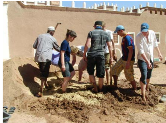
Last man stamping