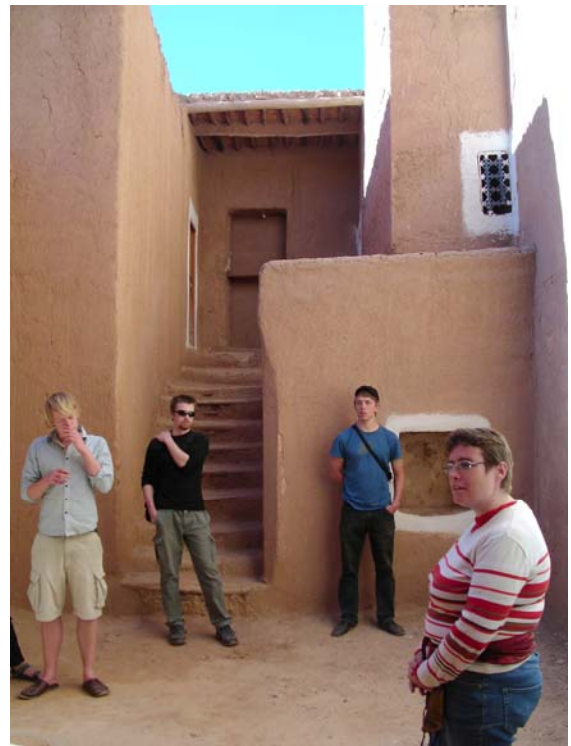
Auf den Spuren der Aid el Caid