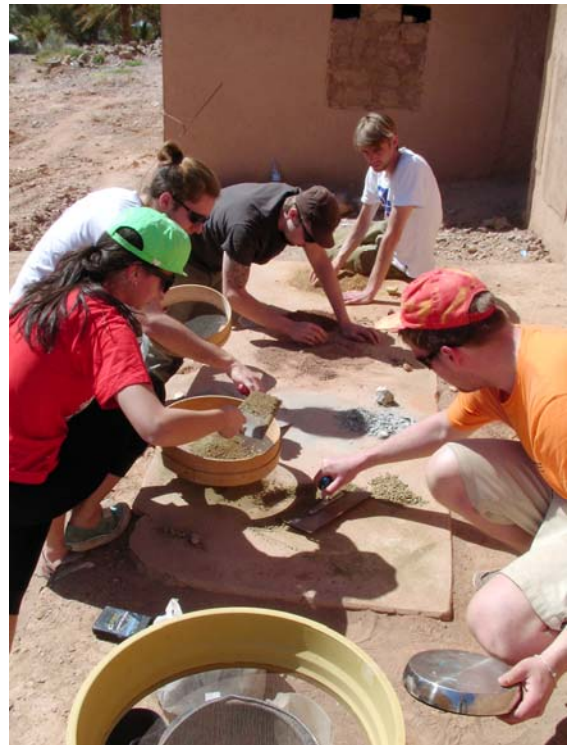
Sortieren, Vorbereiten, Aussieben der Lehmproben