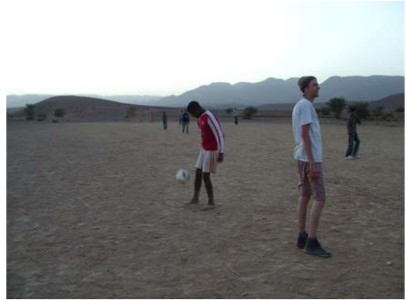
Aus, Aus, das Spiel ist aus

Am Nachmittag Fussballspiel gegen eine Asslim-Auswahl: Asslim-Team – Kasbah-Team 4:2