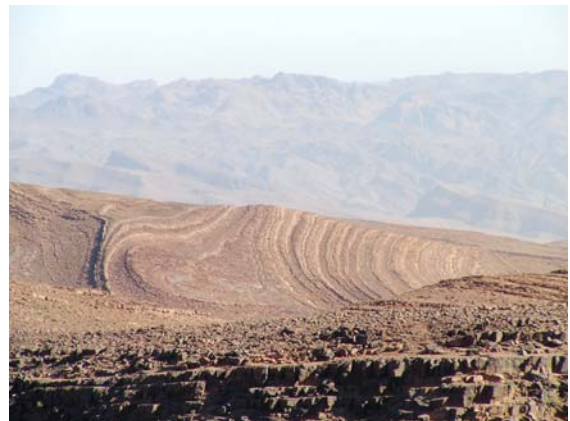
Beeindruckende Landschaften auf dem Weg nach Ouarzazate

Danach Mittagessen im Strassen-Imbiss (Hühnchen mit Pommes) Besuch der Ksar Ait Benhaddou (Unesco Weltkulturerbe)