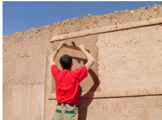
Manfred trägt das erste Testfeld auf