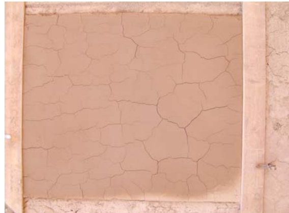
Am nächsten Tag ist es voller Risse