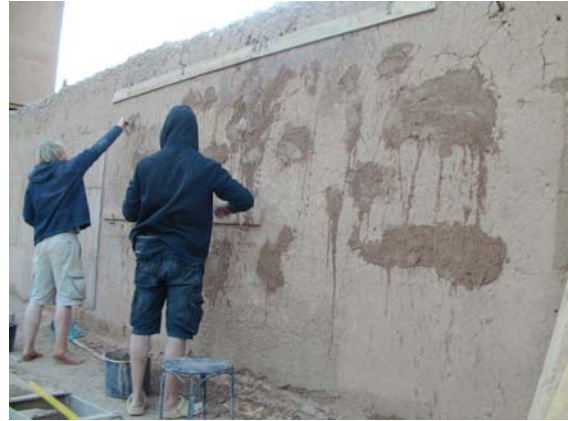
Vorbereitung der Lehmputzfelder

Wieder mit Streichkelle glatt ziehen und 2-3 mal wiederholen, der Putz wird dadurch verdichtet (Lufteinschlüsse werden geschlossen). Hierbei sollte die Verarbeitbarkeit und die Art der Werkzeuganwendung geprüft werden.