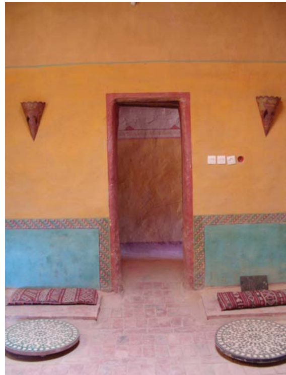
Raum des Friedens

Anschliessend Spaziergang an der alten Ksar vorbei durch die Oase bis hin zum Fluss.