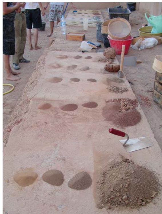
Die sortierten Ergebnisse