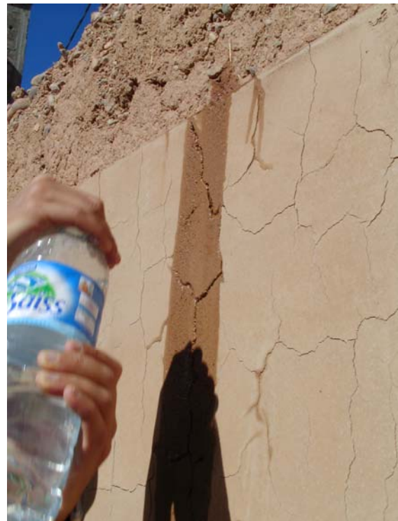
Der Wassertest deckt alle Schwächen auf