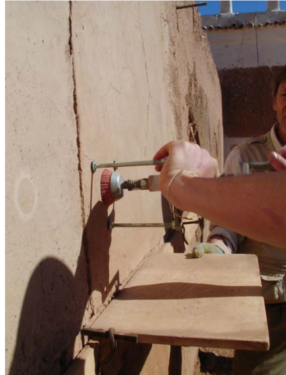
Abreibtest an den Lehmputzen

Für die Verputzarbeiten am Anbau wird ein tollkühnes Baugerüst erstellt.