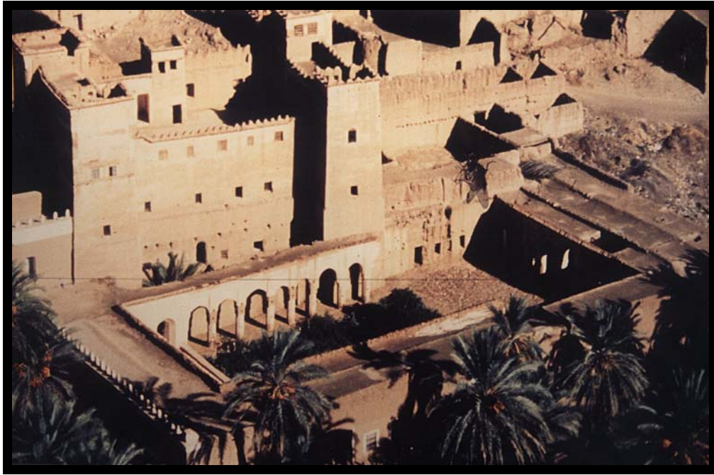
Im Hintergrund die Kasbah Asslim, davor der Arkadenhof mit seinen umgestürzten Säulen, 1997.