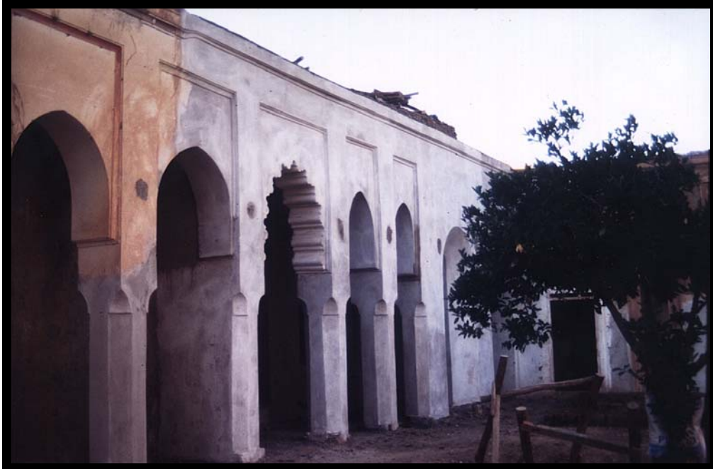
Die im Jahr 2001 fertiggestellten Säulen mit den verzierten Bögen. Es wurde ein kalkvergüteter Lehmputz verwendet, der mit einer Kalkmilch wetterfest gestrichen wurde. Bei diesen Verputzen arbeiteten ausschließlich Lehm- und Stuck-Fachkräfte mit.