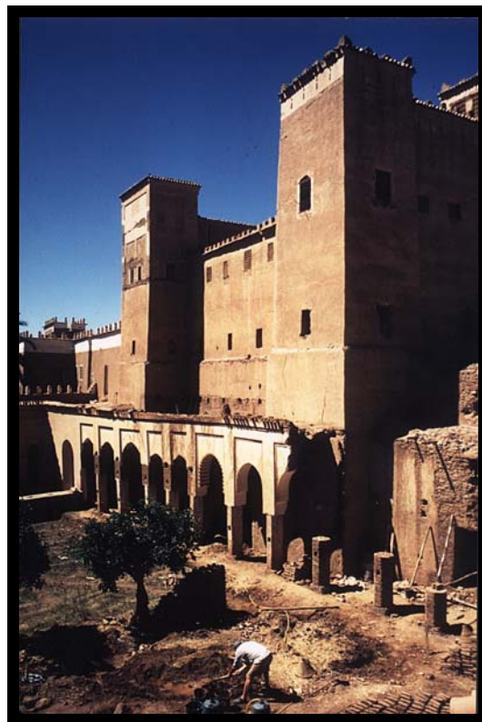
Der Arkadenhof beim Wiederaufbau 1998. Rechts die Rekonstruktion der zerstörten Säulen. Vorn ein Praktikant bei der Herstellung von Lehmziegeln.